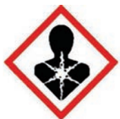
GHS08 schadelijk voor de gezondheid

Sommige stoffen kunnen op lange termijn de gezondheid schaden en tasten bijvoorbeeld organen aan of veroorzaken kanker. Ze worden aangeduid met symbool GHS08.