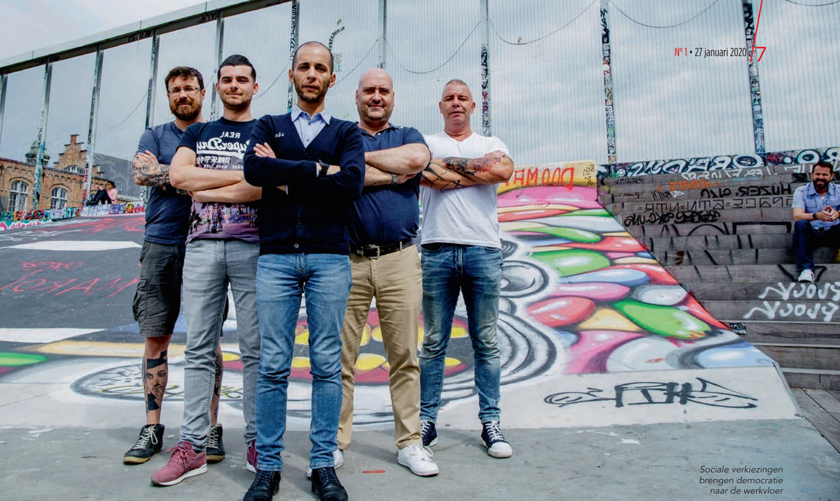
Sociale verkiezingen brengen democratie naar de werkvloer

Al zijn akkoorden niet altijd binnen bereik. Dan zou het tot werknemersactie kunnen komen. Ook hierin spelen de afgevaardigden een hoofdrol. Als de onvrede bij de collega's groot is, dan is het aan de afgevaardigden om die te kanaliseren en om de beste manier te zoeken om de druk op de ketel hoog te houden.