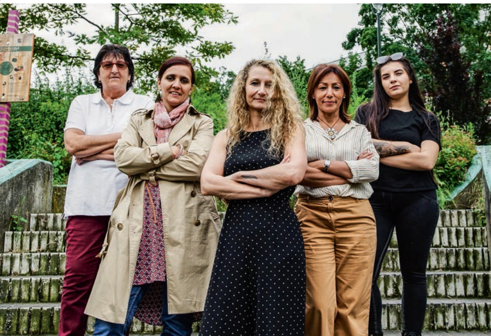
Bij onderhandelingen tussen partijen van goede wil is het vaak mogelijk om akkoorden te bereiken die werknemers en werkgevers ten goede komen

Het is in beide overlegorganen de bedoeling om te onderhandelen met de werkgever en uiteindelijk tot akkoorden te komen die alle werknemers ten goede komen. Dat gaat soms vlot, en ook soms hard. Tussen constructieve partijen is het doorgaans mogelijk om degelijke akkoorden te sluiten. Dit komt zowel de werknemer als de werkgever ten goede.