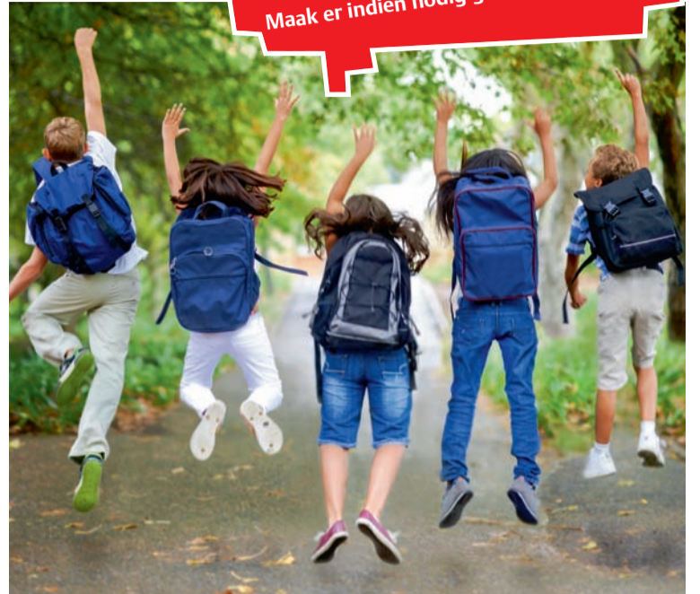
■ Iedereen heeft af en toe vakantie nodig. Informeer je bij het ABVV over je rechten.