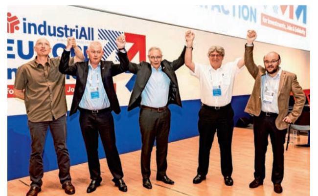
■ Nieuwe leiding IndustriALL Europa.

Europese strategie. Onze Europese samenleving is gebouwd op culturele en etnische diversiteit. IndustriALL wil deze erfenis in stand houden. De nieuwe secretaris-generaal onderstreepte ook dat "de vluchtelingencrisis geen excuus kan zijn om de arbeidsvoorwaarden te ondergraven of om collectieve arbeidsovereenkomsten opzij te schuiven. IndustriALL zal ervoor strijden dat vluchtelingen en migranten dezelfde rechten hebben als alle andere werknemers."