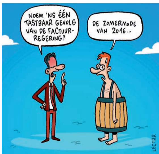
■ Cartoonist Lectrr tekende speciaal voor de campagne deze cartoon

Na de volwassen versie is er nu ook een jongerenversie van onze webtool factuurgeneratie.be , toegespitst op scholieren en studenten tussen 15 en 24 jaar: www.factuurgeneratie.be .