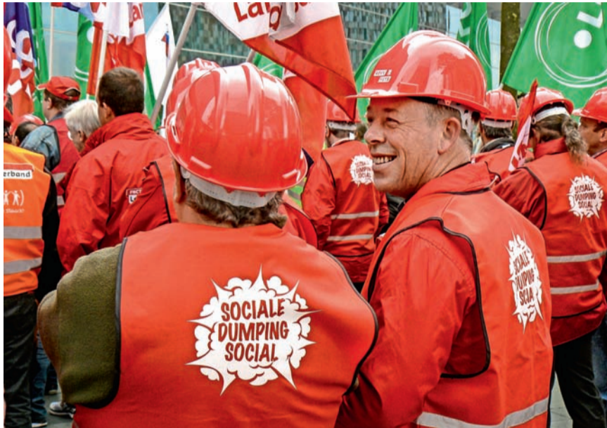
■ Actievoerders vragen in Luxemburg een kordaat optreden tegen sociale dumping.

Sociale dumping is een heus kankergezwel voor onze economie. De Europese ministers van Werk zaten op 16 juni bijeen om nieuwe maatregelen te bespreken. Vakbondsmensen maakten er gebruik van om een kordaat optreden te bepleiten.