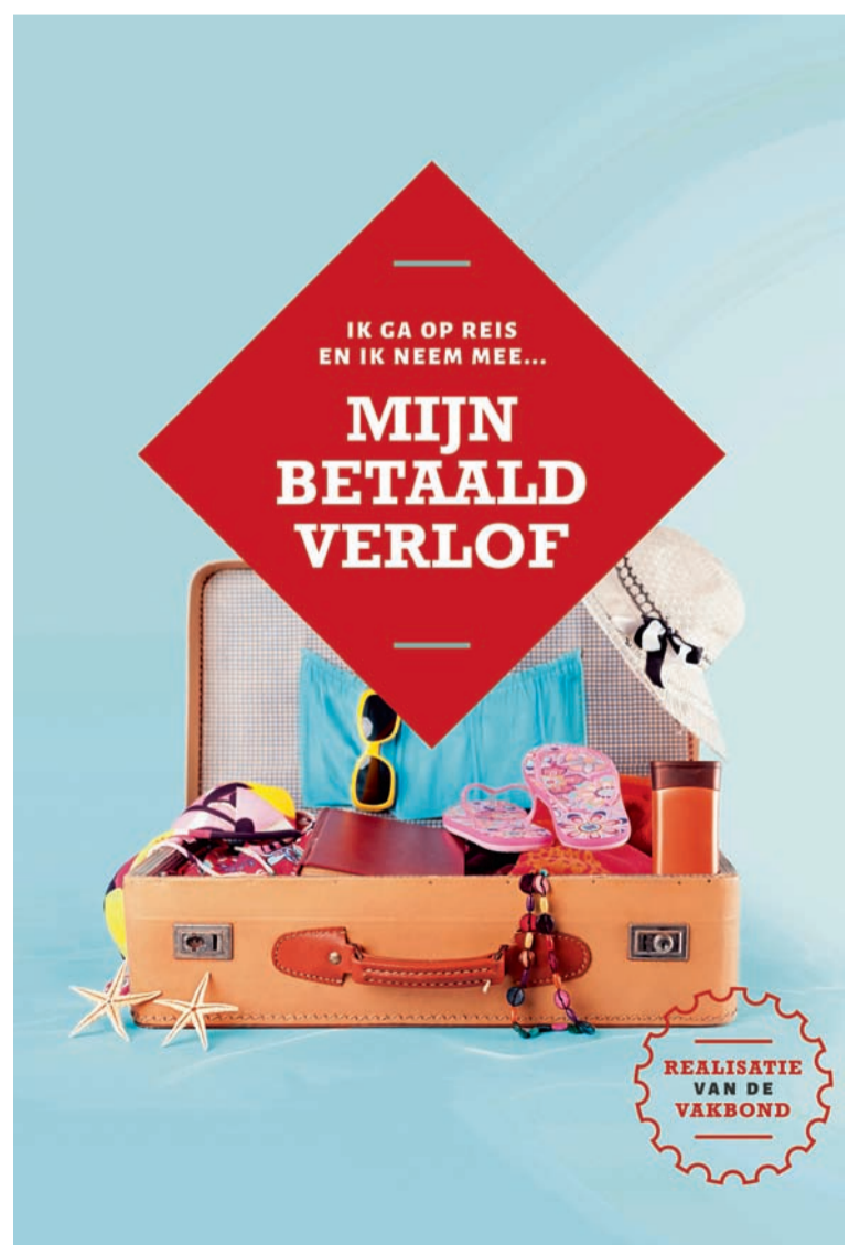
■ Campagne van ABVV-Metaal over de vele realisaties van de vakbond. Je vindt ze allemaal op www.abvvmetaal.be

De syndicale actie (betogingen en stakingen) in 2003 en 2005 als protest tegen het Generatiepact is uitmond in het systeem van de welvaartsaanpassing van de sociale uitkeringen. Hierdoor volgen de uitkeringen de loonevolutie en worden ze aangepast aan de welvaart (bovenop de index).