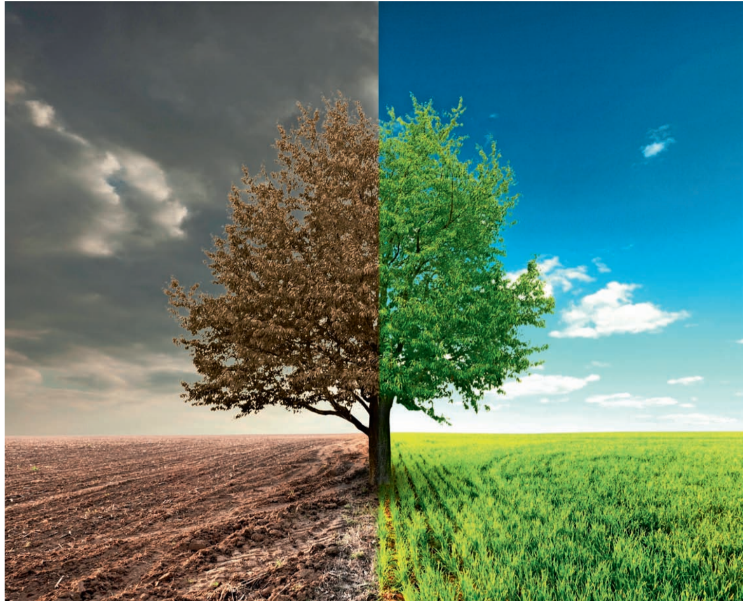
■ Niets doen tegen de klimaatverandering zou de economie beschadigen en de kosten voor welzijn en gezondheid explosief doen toenemen.

Het verhoogde sterftecijfer zou de uitgaven in de gezondheidszorg doen toenemen, maar ook leiden tot het verlies van een groot aantal werkdagen en tot een verstoring van de activiteit. Dit raakt een gevoelige snaar bij ondernemers en overheden: de algemene gezondheidsuitgaven als gevolg van de ver-