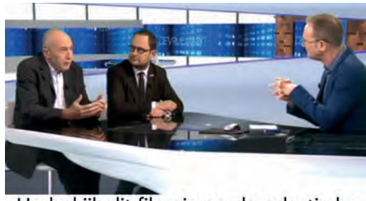
Herbekijk dit filmpje op deredactie.be

45 jaar effectief werken. Dit wordt de lijn van onze regering voor alle uitkeringen.