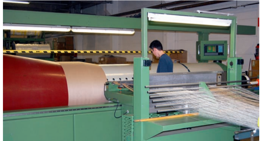
■ In de textielsector moet er werk gemaakt worden van een beter evenwicht tussen werk en privé

Textielondernemingen zullen gestimuleerd worden om hiervoor projecten op touw te zetten. Zij kunnen die indienen bij het opleidingscentrum voor de sector Cobot en een financiële tegemoetkoming genieten die overeenstemt met maximum 0,10 procent van de loonmassa in de onderneming. Onze vakbondsafgevaardigden gaan met hun bedrijfsleiding rond de tafel zitten om concrete projecten uit te werken. Hun plannen zullen ingediend