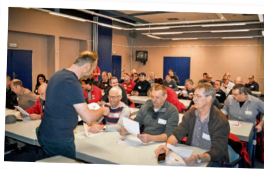
■ Opleiding over actievoeren via sociale media: Facebook en Twitter als syndicaal wapen