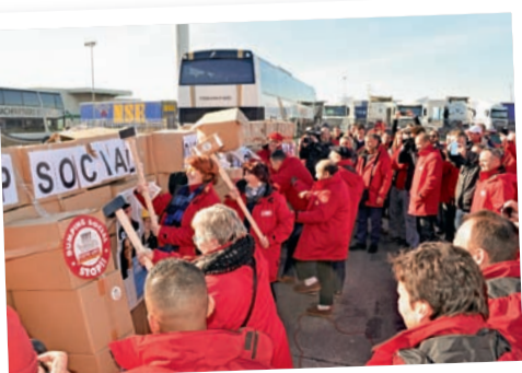
■ De muur van de sociale dumping die de transportsector verdeelt, gaat aan diggelen