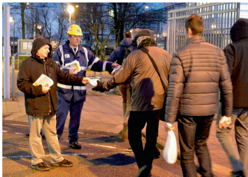
■ ABVV-delegees verdelen brochure over werkbaar werk in de chemie. Op hen kun je rekenen om het werk gezond en leefbaar te houden.

Moet jij ook van god naar klein pierke lopen? Weet ook jij niet meer waar je hoofd staat? Droom ook jij van werkbaar werk? Zodat je gezond kunt blijven. Zodat je werk en privéleven soepel aan elkaar kunt knopen. Eén ding is zeker: je bent niet alleen.