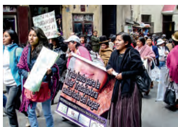
■ Vrouwen in Bolivia roeren zich. Ze werken als huishoudster en eisen sociale rechten. Er is nog een lange weg af te leggen, stelt de Internationale Arbeidsorganisatie.

In ieder geval is sociale zekerheid voor huishoudelijke werksters een betaalbare zaak, besluit nog de IAO. Heel wat ontwikkelingslanden werken trouwens nu al aan betere bescherming. Landen als Mali, Senegal en Vietnam staan daar al heel ver mee. Maar de weg is nog lang. We zullen nog lang in de weer moeten blijven om sociale zekerheid voor iedereen te garanderen.