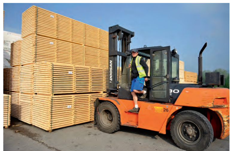
■ Werknemers uit de sectoren van de houtbewerking kunnen gratis op onderzoek om neuskanker vroegtijdig op te sporen

Wil je daar meer over weten? Op onze website www.accg.be vind je in de rubriek 'mijn sector' twee infolders. Je kunt ook terecht bij het FBZ: www.fbz.fgov.be , 02 226 62 03 of hout@fbz.fgov.be .