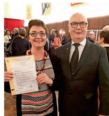
■ Sfeerbeeld van de receptie na de plechtigheid, aangeboden door de Koopvaardij-binnenvaart-Zeevisserij en Nautische diensten.

De plechtigheid werd op een aangename en deskundige manier gepresenteerd door Wim De Vilder.