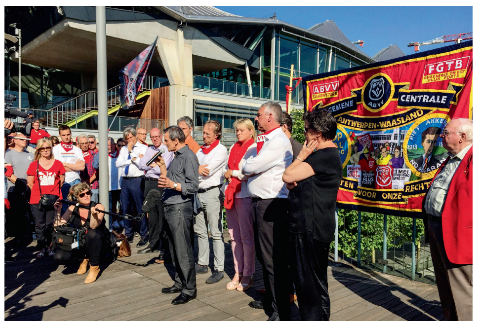
■ ABVV-militanten dagen massaal op aan het Antwerpse gerechtsgebouw om hun kameraden te steunen

vakbonds-vrijheid zonder de mogelijkheid om collectief actie te voeren.”