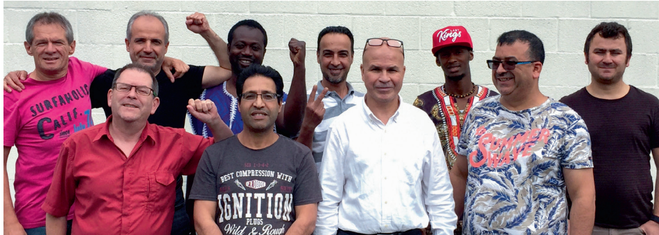
■ "Regelmatig kwam iemand vertellen hoeveel plezier hij aan de vorming beleefde."

Vorming & Actie (V&A), de interprofessionele vormingsdienst van het Vlaams ABVV, heeft zijn eerste vorming voor anderstaligen achter de rug.