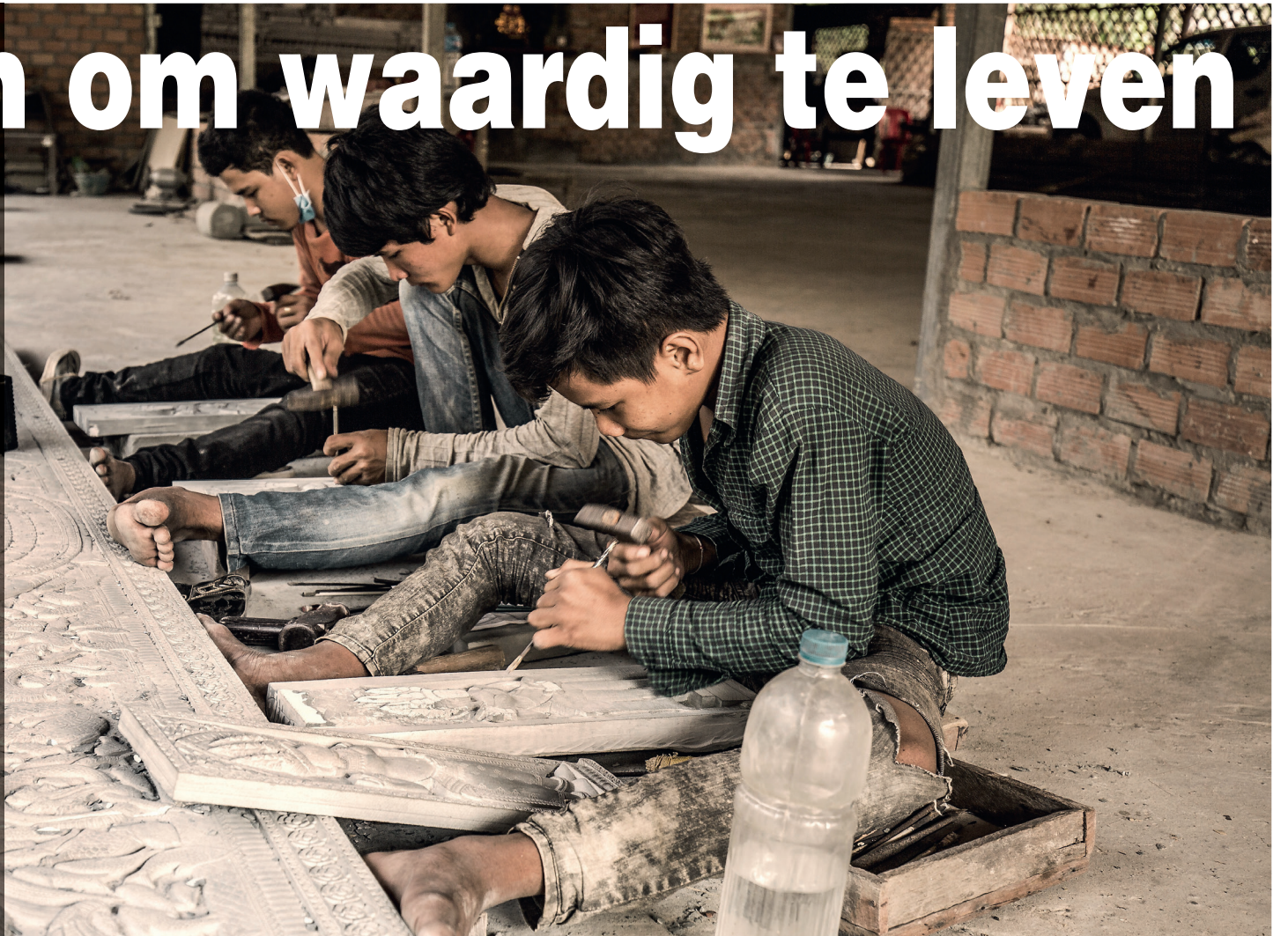
■ Wereldwijd zijn naar schatting nog 168 miljoen kinderen het slachtoffer van kinderarbeid

7 oktober is de Internationale Dag voor Waardig Werk. Achter deze datum op de kalender schuilt een dagelijks terugkerende realiteit: misbruik en uitbuiting van miljoenen werknemers overal ter wereld. Werknemers die geen 'waardige' levensomstandigheden, arbeidsomstandigheden en lonen hebben. Door dit probleem aan te kaarten, herhalen we het belang van sterke vakbonden en een stevige sociale bescherming voor iedereen, mannen en vrouwen.