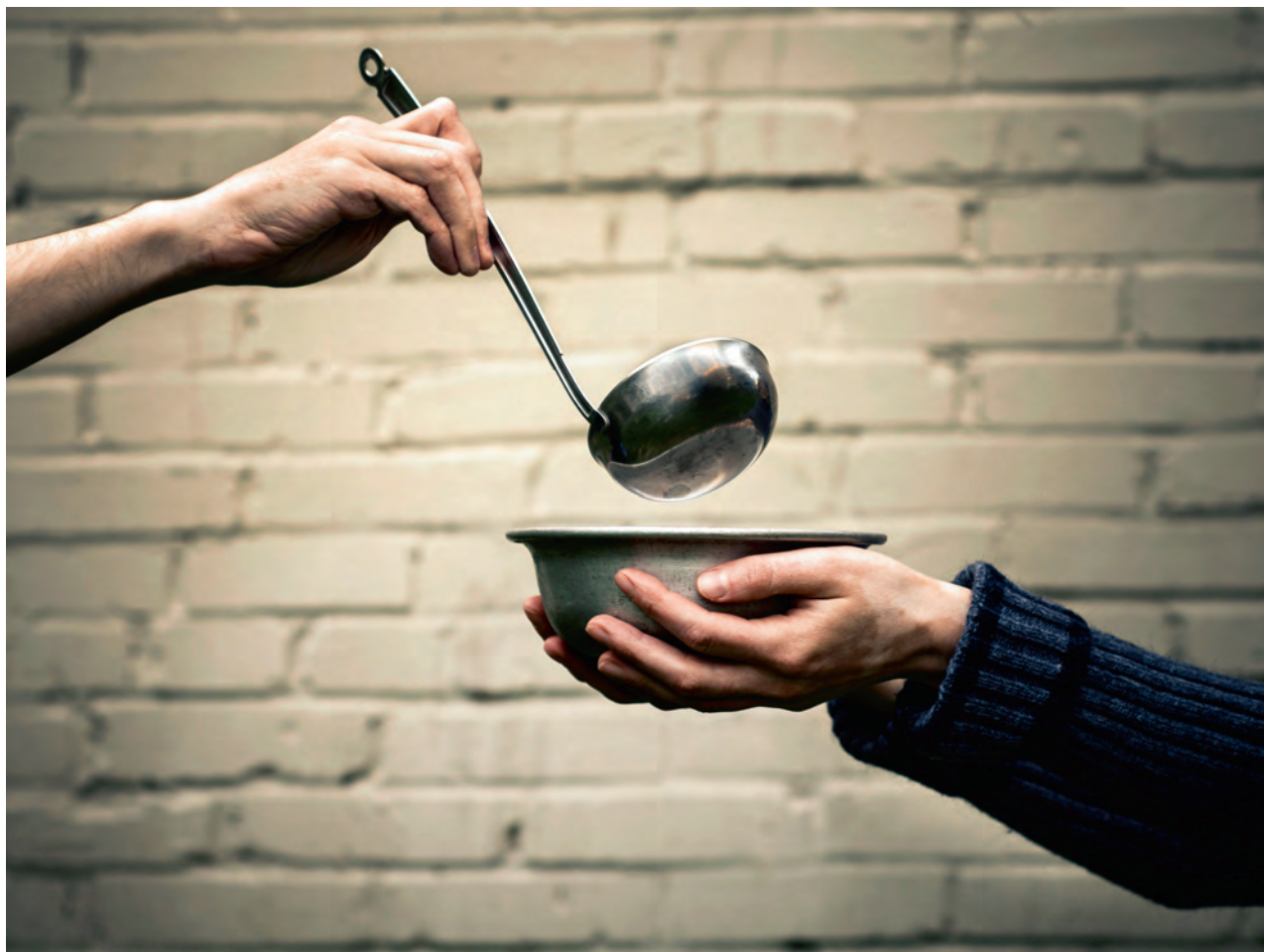
■ Vorig jaar klopten voor het eerst meer dan 150.000 mensen aan bij de voedselbanken.

Veel, té veel mensen hebben moeite om rond te komen. Alsof hun situatie nog niet moeilijk genoeg is, zien ze vaak hun grondrechten beknot. Dat kan niet. Wij zijn allemaal volwaardige burgers. Bovendien is er voldoende rijkdom zodat iedereen het goed kan hebben. Maar dan moeten overheden rechtvaardige beleidskeuzes maken.