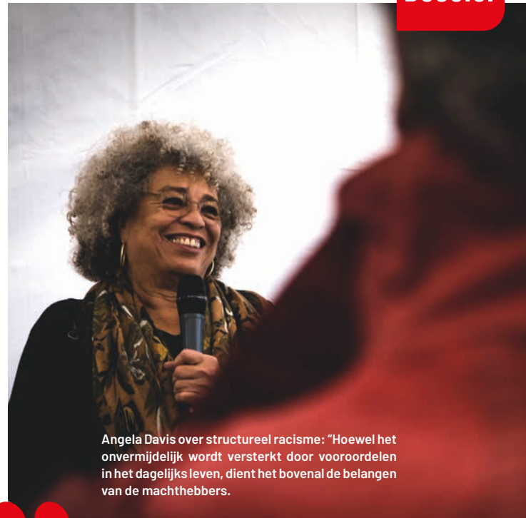
Angela Davis over structureel racisme: “Hoewel het onvermijdelijk wordt versterkt door vooroordelen in het dagelijks leven, dient het bovenal de belangen van de machthebbers.