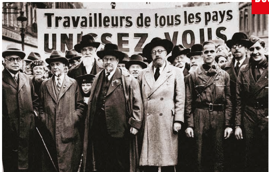
“Arbeiders aller landen, verenigt u”