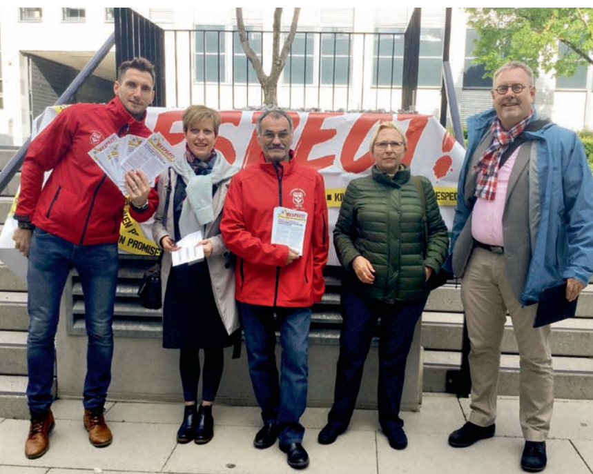
Tijdens de raad van beheer maakten vertegenwoordigers van de Algemene Centrale - ABVV en IndustriALL Global Union van de gelegenheid gebruik om meer respect te vragen voor werknemers over de hele wereld

De militanten wilden vooral de aandeelhouders de ogen openen, te tonen hoe het dagelijks leven als werknemer eruitziet bij LafargeHolcim. Het valt nog te bezien of dit bij de aandeelhouders is aangekomen of dat enkel hun dividend telt. LafargeHolcim moet in ieder geval dringend zijn politiek in vraag stellen en respect tonen voor zijn werknemers en het sociaal overleg. Militanten en vakbonden zullen hierop blijven hameren. ■