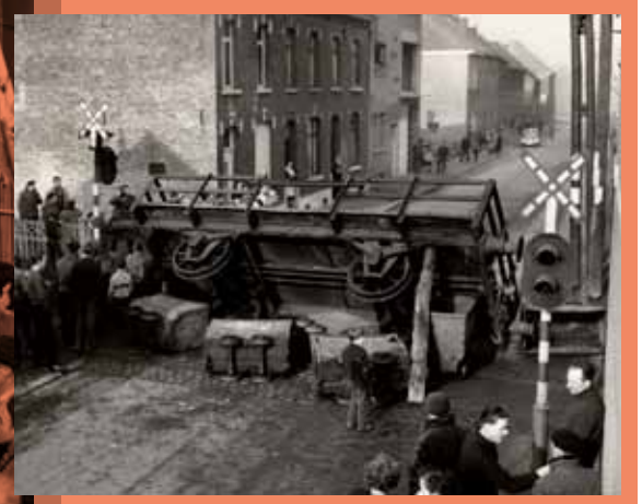
Beeld uit de mijnstaking van 1959. Met een omgekeerde goederenwagon trachten de stakers het verkeer te verstoren in Paturages.