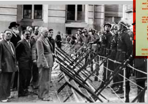
☐ Sfeerbeeld uit een antileopoldistische betoging in Brussel in 1950. Minister van Staat Louis de Brouckère en afgevaardigden van de socialistische vakbeweging vragen vrije doorgang.