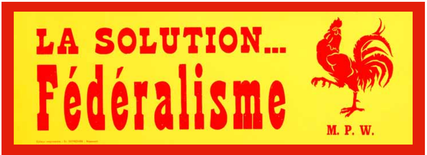
📍 Affiche waarmee de Mouvement Populaire Wallon andermaal een pleidooi houdt voor het federalisme.