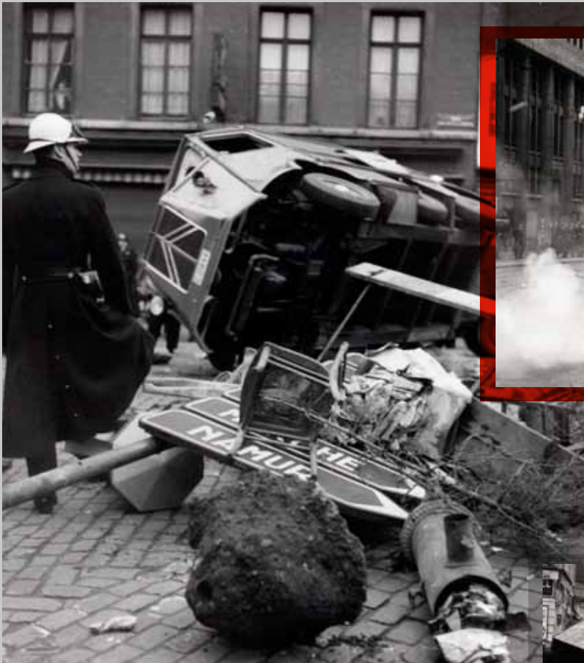
📍 Vernielingen aangericht door stakers in Luik, 6 januari 1961.