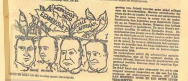
Collage van socialistische dag- en weekbladen die tijdens de staking bleven verschijnen om de achterban over de gebeurtenissen te kunnen berichten.

De socialistische partij bevecht het ontwerp tot eenheidswet genadeloos. De socialistische partij bevecht het ontwerp tot eenheidswet genadeloos.