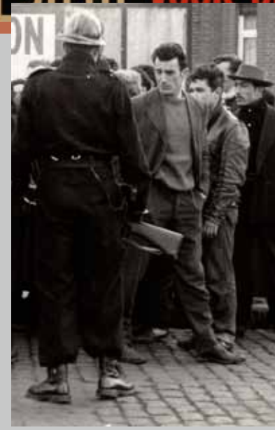
Beeld uit de mijnstaking van 1959. Stakers ondernemen half februari een poging om hun medestanders, opgepakt na een meeting in Quaregnon, uit de gevangenis van Bergen te bevrijden.