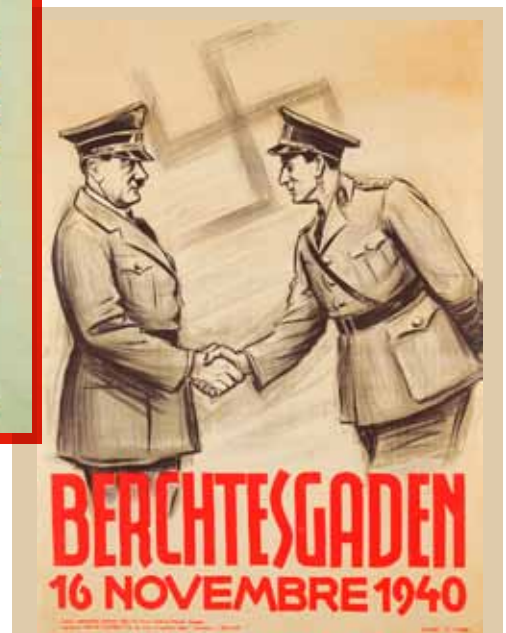
☐ Affiche die de rol van de koning tijdens de Tweede Wereldoorlog en in het bijzonder zijn ontmoeting met Hitler in Berchtesgaden hekelt.