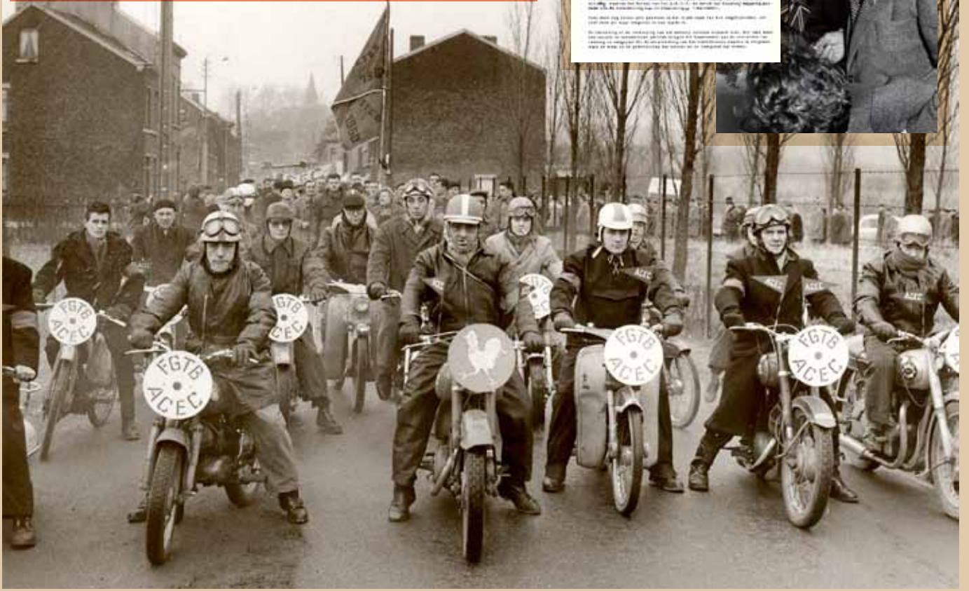
1 Gemotoriseerd verzet tegen de Eenheidswet in Charleroi tijdens de nationale actiedag van het ABVV op 14 december 1960.

de algemene CENTRALE De Algemene Centrale van de ABVV heeft de volgende resolutie aangenomen op 14 december 1960: De Algemene Centrale van de ABVV heeft de volgende resolutie aangenomen op 14 december 1960: De Algemene Centrale van de ABVV heeft de volgende resolutie aangenomen op 14 december 1960: