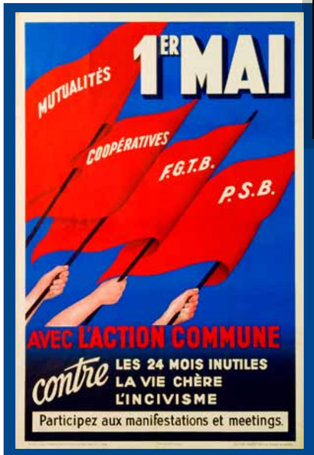
ⓘ 1 mei-affiche van de Socialistische Gemeenschappelijke Actie tegen de 24 maanden legerdienst, het dure leven en het incivisme, begin jaren 1950.