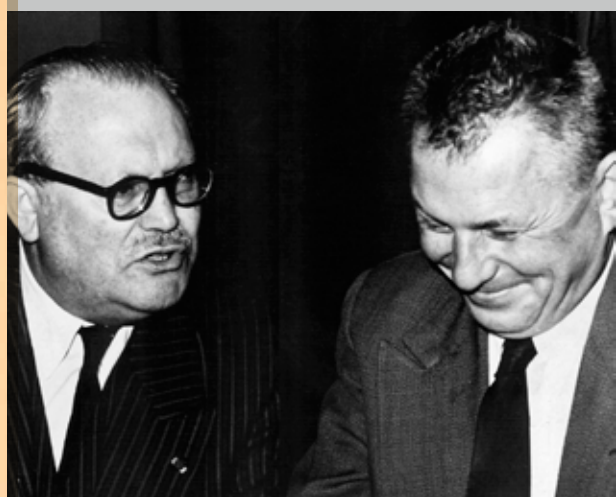
➔ Achiel Van Acker en André Renard, respectievelijk politiek en syndicaal kopstuk van het verzet tegen de Eenheidswet.

② Affiches van het ABVV naar aanleiding van verkiezingen voor de ondernemingsraden eind jaren 1950, begin jaren 1960, waarmee het socialistische vakverbond het belang van de structuurhervormingen beklemtoonde. (Amsab-ISG, Gent)