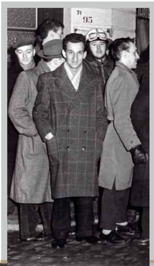
Ook de ACOD van Luik staakt vanaf dag één mee en roept zelfs al op 14 december 1960 op om zes dagen later in staking te gaan.