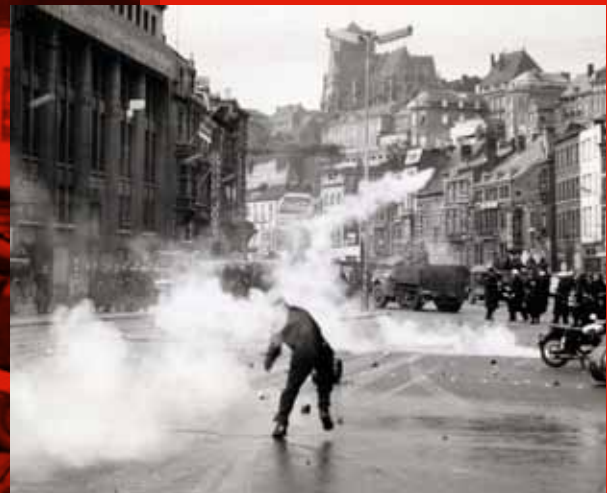
📍 Na een meeting met André Renard op de Place Saint-Paul, komt het in de namiddag van 6 januari 1961 tot zware rellen in de 'vuurige stede' Luik. Het station Guillemins, de lokalen van de krant La Meuse , de lokalen van de Middenstandsunie ... worden bestormd.