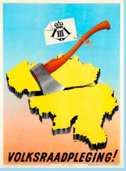
☐ Affiche die waarschuwt voor de gevolgen van een eventuele terugkeer van Leopold III op de troon na de volksraadpleging van 12 maart 1950.

Op 12 maart 1950 werd een referendum gehouden over de kwesie. Vlaanderen stemde ruim voor de terugkeer van Leopold III, Wallonië en Brussel massaal tegen. Uiteindelijk was meer dan de helft van de Belgen voor. Met de parlamentsverkiezingen later op het jaar haalde de toenmalige CVP de absolute meerderheid. Niets stond de terugkeer van Leopold III nog in de weg, behalve het ABVV. De socialistische vakbond ontketende een staking in de Waalse industriebekkens. Tijdens confrontaties met de ordediensten in Grâce-Berleur vielen vier doden. Er werd bedreigd met het uitroepen van een Waalse republiek. De staking breidde zelfs uit naar Vlaanderen. Omdat de situatie prerevolutionaire trekjes kreeg, trad Leopold III alsnog af. Boudewijn volgde hem op. Ook in de schoolkwesie stonden vrijzinnigen en katholieken in de jaren 1950 tegenover elkaar.