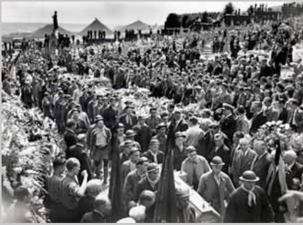
☐ Begrafenis van de slachtoffers van Grâce-Berleur op 2 augustus 1950.