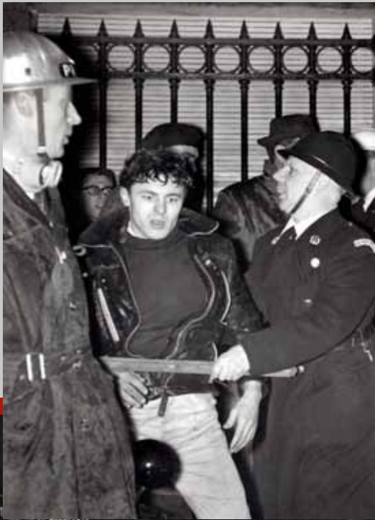
☞ Ordediensten houden een staker in bedwang, Brussel, 4 januari 1961.

Tussen 3 en 5 januari 1961 volgden de eerste gedeeltelijke werkhervattingen in Vlaanderen en Brussel. In Wallonië hield de staking voorlopig stand, maar sabotageacties en straatgevechten in Luik maakten de situatie er wel grimmiger. Op 6 januari vond in Luik op de Place Saint-Paul een massabijeenkomst plaats. Stakers bestormden het station Guillemins. Bij gewelddadige confrontaties met de ordestrijdkrachten lieten twee betogers het leven. Vanaf 7 en 8 januari waren er in Luik en Henegouwen sabotageacties. Overheid en stakers stonden meer dan ooit tegenover elkaar. In de volgende dagen volgden ook in Wallonië de eerste werkhervattingen. Tijdens de staking vielen in totaal vier doden.