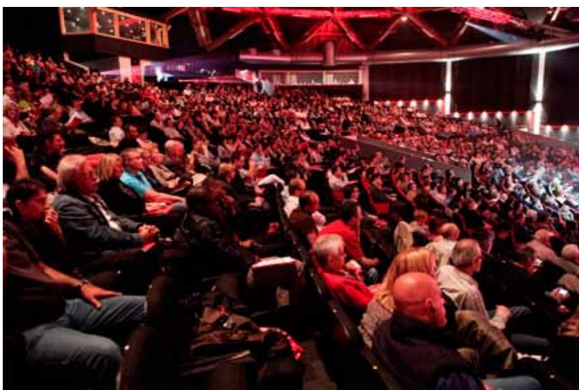
📍 Statutair congres van het ABVV, juni 2010. (ABVV, Brussel)