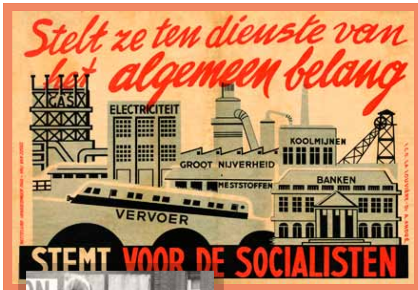
Verkiezingsaffiche van de Belgische Socialistische Partij, die de nationalisatie van de sleutelsectoren van de economie eist. (Amsab-ISG, Gent)