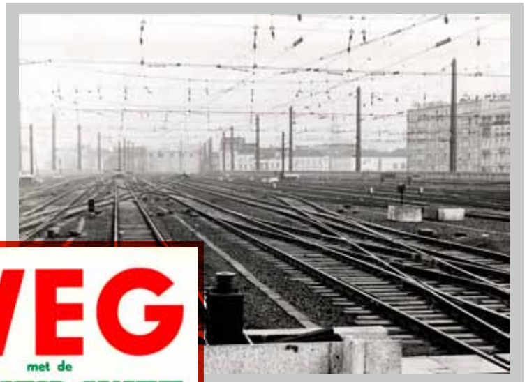
De lege reïnsproren van het station Brussel-Zuid op 23 december 1960 illustreren dat de staking snel uitbreidde.