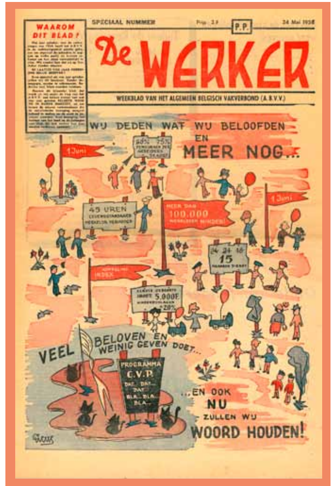
① Het ABVV-weekblad De Werker onderschrijft het verkiezingsprogramma van de Belgische Socialistische Partij tijdens de parlementsverkiezingen van 1958.

➔ Het ontwerp van de gewraakte Eenheidswet, dat de regering-Eyskens-Lilar begin november 1960 indiende.