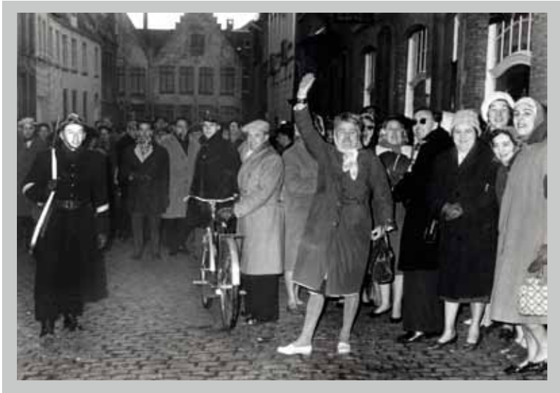
☉ De staking in Brugge, eind december 1960.

Na een snelle start breidde de staking zich langzaam maar zeker ook over Vlaanderen en Brussel uit. In de voornaamste Waalse steden en Brussel vonden vanaf 27 december 1960 massabijeenkomsten plaats. Die dag besloot het nationaal comité van het Algemeen Christelijk Vakverbond (ACV) zich definitief afzijdig te houden. Een dag later kwam het bij een massabetoging in Gent een eerste keer tot gewelddadige confrontaties met de ordetroepen. Nadien sloten steeds meer Vlaamse gewesten van het ABVV zich bij de staking aan. Op 30 december bereikte het aantal stakers een hoogtepunt.