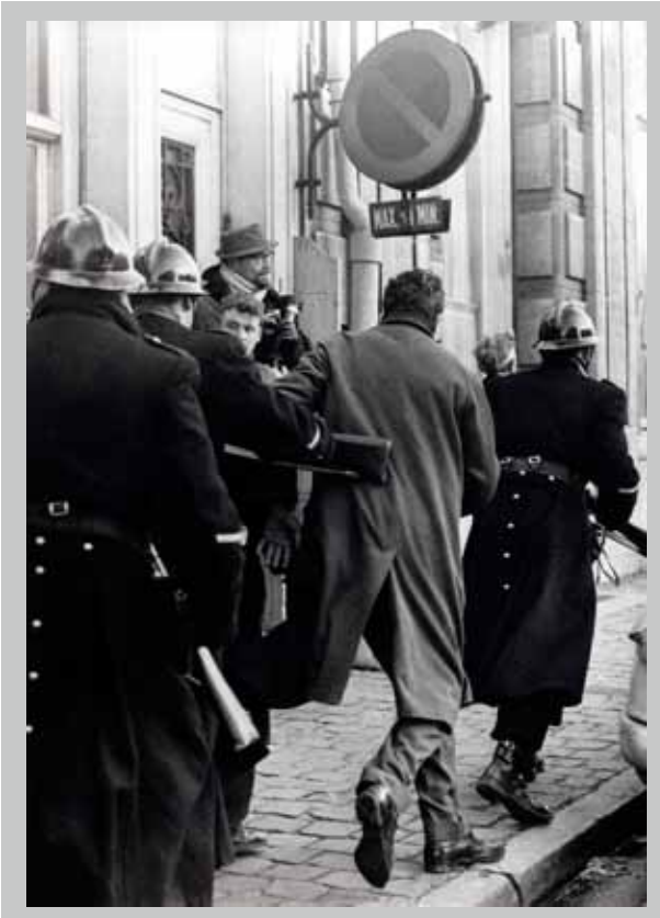
☛ Sfeerbeeld van een staking die altijd maar grimmiger wordt, Brussel, 3 januari 1961.