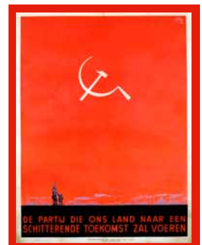
ⓘ Verkiezingsaffiche van de Kommunistische Partij van België naar aanleiding van de parlamentsverkiezingen van 1946. (Dacob, Brussel)