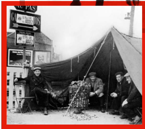
☛ De onvrede van de stakers krijgt een regionalistisch tintje. Een stakerspiket in Haine-Saint-Pierre, 2 januari 1961.