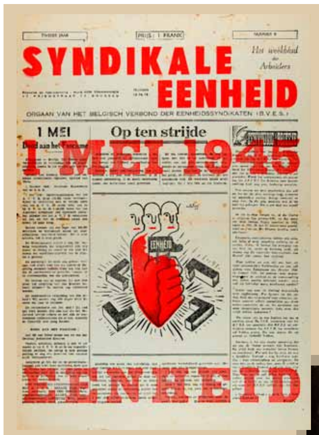
ⓘ Syndicale Eenheid, het orgaan van het Belgisch Verbond der Eenheidssyndikaten dat bij de Kommunistische Partij van België aanleunde.

De Tweede Wereldoorlog zorgde voor een politieke omwenteling. De Kommunistische Partij van België groeide door haar rol in het verzet uit tot een machtsfactor. In 1946 haalde de partij bijna 22 procent van de stemmen. Ze werd opgenomen in de regering, tot in 1947 de Koude Oorlog in volle hevigheid uitbrak. Drie jaar later was de partij nog nauwelijks 8 procent van de stemmen waard. Haar politieke rol was nagenoeg uitgespeeld. Het communistische intermezzo had gevolgen voor de vakbeweging. Voor de Tweede Wereldoorlog maakte de Syndikale Commissie, de voorloper van het ABVV, integraal deel uit van de Belgische Werkliedenpartij. Wie aansloot bij de socialistische vakbond, mutualiteit of coöperatie, was in één klap ook lid van de partij. Na de oorlog was dat minder vanzelfsprekend. Tijdens de oorlog waren namelijk in het verzet de syndicale stromingen Mouvement Syndical Unifié van André Renard en Algemeen Syndicaat der Openbare Diensten ontstaan. Die vormden op het fusiecongres van 28 en 29 april 1945, samen met de communistische eenheidssyndicaten en het Belgisch Vakverbond (sinds 1937 de opvolger van de Syndikale Commissie) het ABVV, maar wilden geen directe band met de socialistische partij. Die gedachtegang domineerde zolang de communisten in de regering zaten, maar de oprichting van de Socialistische Gemeenschappelijke Actie luidde een nieuwe samenwerking in tussen partij, vakbond, mutualiteit en coöperatie.