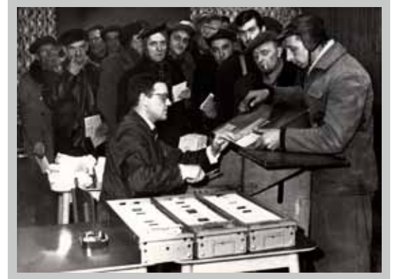
Controle van de werklozen eind jaren 1950, begin jaren 1960.