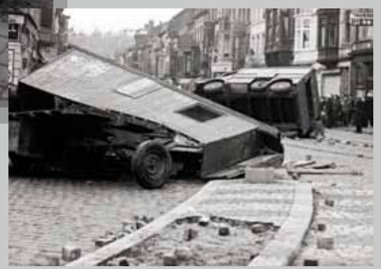
📍 Op de hoek van de Rue des Guillemins in Luik kieven stakers twee vrachtwagens om en wrikken ze kasseien uit de straat, wellicht om er de politie mee te bekogelen, 6 januari 1961. (Amsab-ISG, Gent)