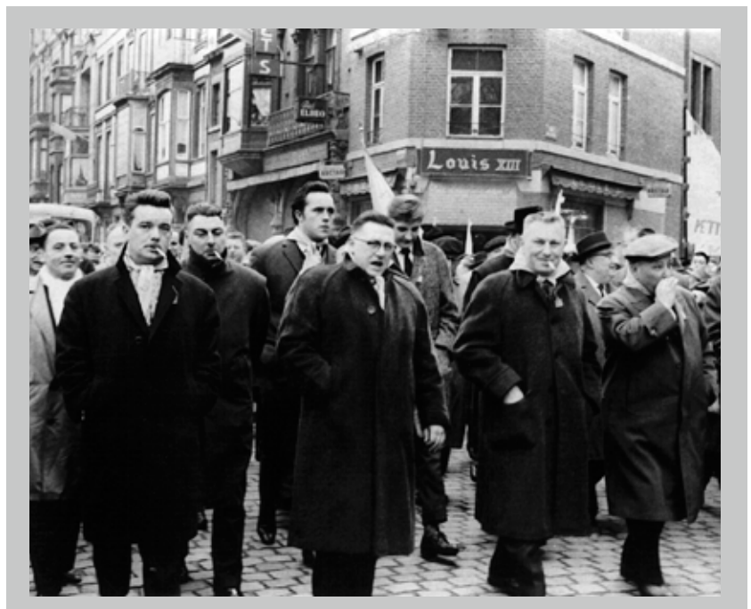
📍 Optocht van de Mouvement Populaire Wallon in Luik op 15 april 1962, met aan het hoofd onder meer André Renard.

Hoewel de staking voor het ABVV geen onverdeeld gelukkige afloop kende, zwoer de socialistische vakbond haar programma van 1954 en 1956 niet af, integendeel zelfs. Het Ideologisch Congres van januari 1971 verwierp opnieuw de integratie in het kapitalistische systeem. Via arbeiderscontrole wilde het ABVV nog een stap zetten naar meer economische democratie. Later legde ook het statutair ABVV-congres van 1994 hier nogmaals de klemtoon op.