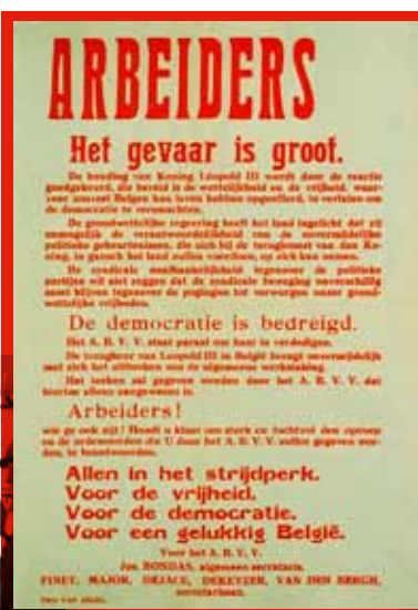
☐ Affiche waarmee het ABVV dreigt met een algemene staking bij een eventuele terugkeer van Leopold III.