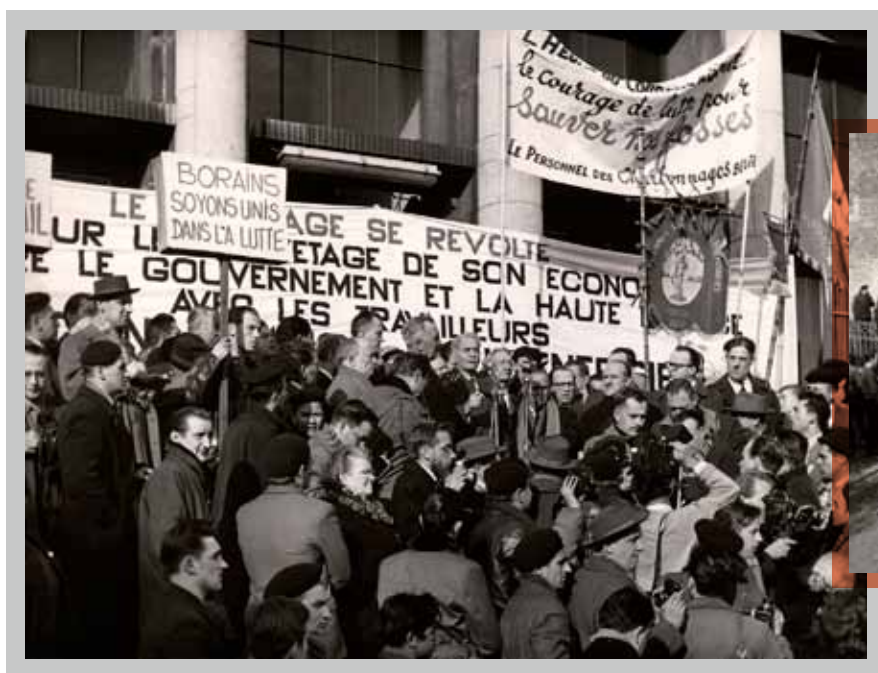
Minister van Staat Achille Delattre spreekt de stakers toe op 16 december 1959 in Quaregnon.

De Belgische economie kwam relatief ongeschonden uit de Tweede Wereldoorlog en kende daardoor een snelle heropleving. De overheid en de privésector investeerden vooral in de traditionele economische sectoren zoals de mijnbouw, de metaalnijverheid en de textielsector. Zij waren de motor van de heropleving en leverden hoge winsten op. Daardoor kreeg België minder financiële steun van het Amerikaanse Marshallplan dan de buurlanden. Die moderniseerden hun economieën met dat geld. In de jaren 1950 wreekte dit zich. De verouderde Belgische industrie kon toen niet meer concurreren met het buitenland. Ons land zakte weg in een diepe structurele economische crisis. Die trof vooral de traditionele industriële sectoren, waarvan het zwaartepunt meestal in Wallonië lag. Het eerste slachtoffer van de crisis was de mijnbouw. Die had ons land rechtgehouden na de oorlog, maar kon zich nadien alleen nog handhaven met overheidssubsidies. Intussen liep ook de vraag naar steenkool terug. De regering-Eyskens-Lilar wilde die situatie snel oplossen door de helft van de Waalse mijnen te sluiten. Dat leidde in Henegouwen tot een algemene mijnstaking. Die ging op 13 februari 1959 in Frameries van start en breidde snel uit naar de andere Waalse mijnbekkens. Metaalarbeiders uit het Centrum en Charleroi sloten zich uit solidariteit aan en op 20 februari waren er al zo'n 100.000 stakers. Later op de maand onderhandelde het ABVV met succes een reconversieplan voor de Waalse mijnwerkers.