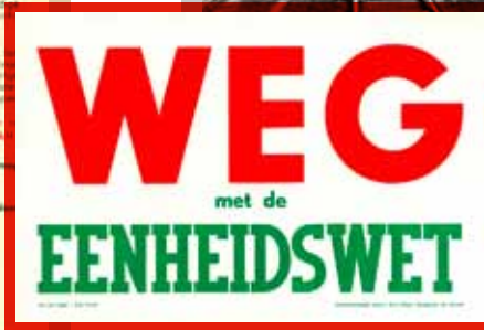
Affiche van het ABVV tegen de Eenheidswet.