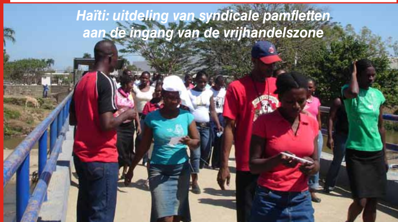
Haïti: uitdeling van syndicale pamfletten aan de ingang van de vrijhandelszone

De zaken zullen niet gemakkelijk veranderen. We stellen immers vast dat de crisis de roep om regulering wel deed toenemen, maar ook dat daar in de praktijk niet echt veel van terecht komt, zeker als het om bescherming van werknemers gaat. Zo beloofden de Wereldbank en het IMF hun beleid aan te passen. Maar ondertussen blijven ze landen onder druk zetten om de sociale bescherming te ontmantelen. Daartegen eist het ABVV dan ook dat alle bestaande engagementen en intentieverklaringen omgezet worden in vaste regels en wetten, bindend voor overheden en bedrijven.