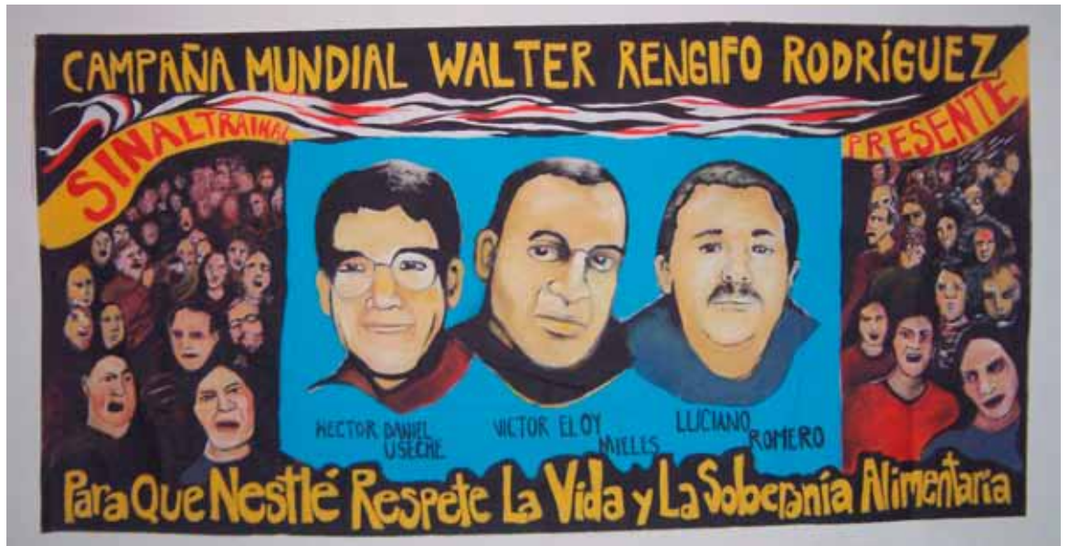
Colombië: vermoorde syndicalisten