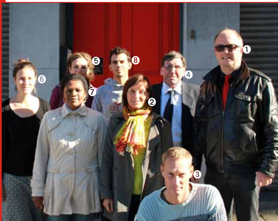
Het team van het Internationaal Departement: