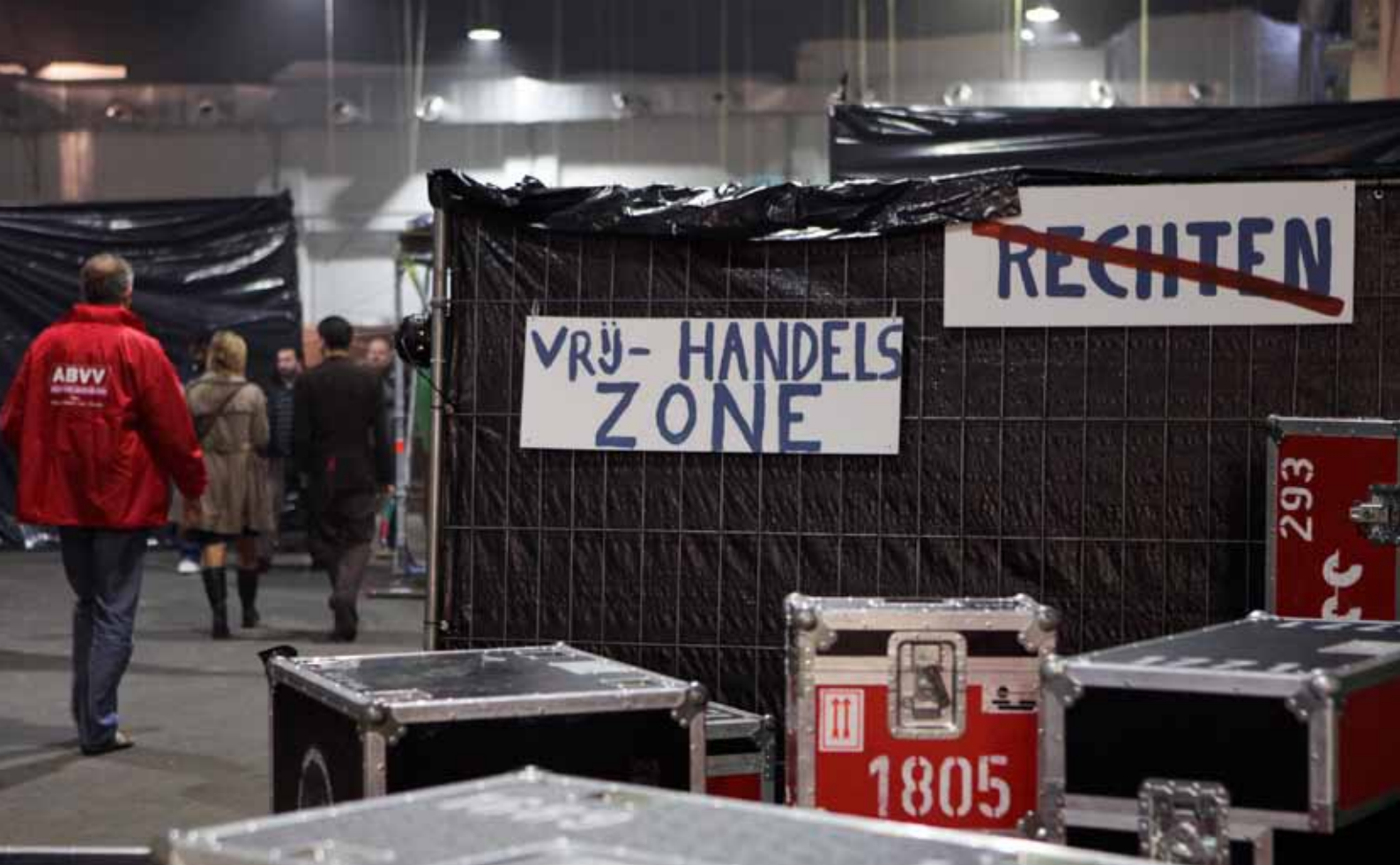
“Vrijhandelszone” militantenconcentratie 09/10/2009 - Tour & Taxi