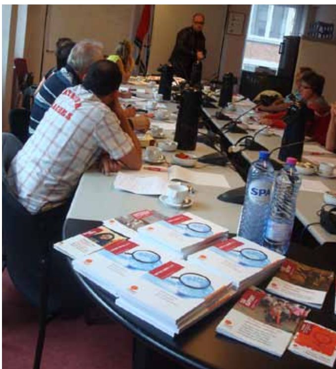
Sensibilisering over kinderarbeid in de cacaoplantages (Horval)

Zolang de syndicale basisrechten ondergraven of geschonden worden, blijven werknemers de dupe. Ze worden tegen elkaar opgestookt en uitgespeeld, worden door veel (gelukkig niet alle!) werkgevers beschouwd als 'gereedschap'. En met als kwalijk gevolg wereldwijd ook een voortdurende druk op de lonen en op de sociale voorzieningen, informalisering van de arbeid, toenemende gedwongen flexibiliteit, ... Bovendien grijpen werkgevers her en der de economische situatie aan om (onder het mom 'genoodzaakt door de mondiale crisis') vakbondswerk extra trachten te fnuiken.