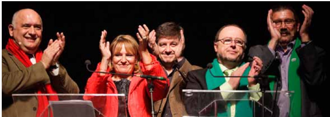
Waardig werk als antwoord op de crisis, 9 oktober 2009: militantenconcentratie, Tour & Taxi

De economische veranderingen als gevolg van de globalisering hebben dus een directe weerslag op de wereldwereld. Het ongebreidelde streven naar rendabiliteit en productiviteit, tegen de laagste kostprijs, is alleen mogelijk ten koste van de werknemers. Deze worden meer en meer geconfronteerd met dreigende productieverplaatsingen, allerlei druk op de arbeidsvoorwaarden en het afkalven van de lonen, die vaak niet aangepast zijn aan de huidige sociaal-economische realiteit.