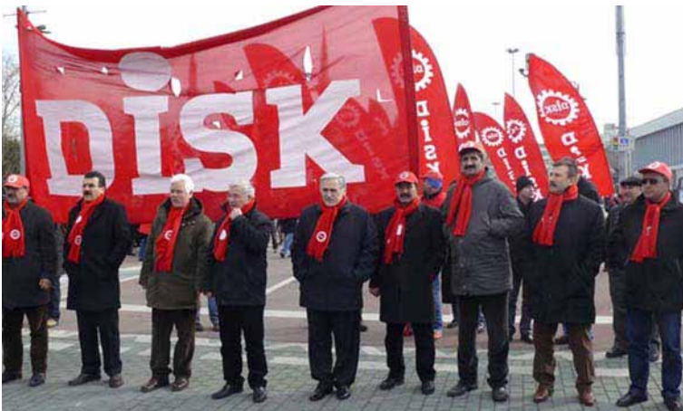
Betoging van een Turkse vakbond

De problematiek van waardig werk is immers niet alleen een 'globaal' probleem, maar ook, en zelfs vooral, een zaak van lokale politici en beleidsvoerders. Zij bepalen de wetgeving inzake sociale rechten, enz. En het zijn ook zij, zowel in het Noorden als in het Zuiden, die erop moeten toezien dat de regelgeving in kwestie nageleefd wordt en – indien nodig – afdwingbaar is. Positief is dat het Belgisch parlement in