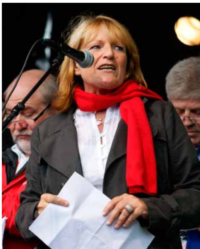
EVV Euromanifestatie 29/09/2010